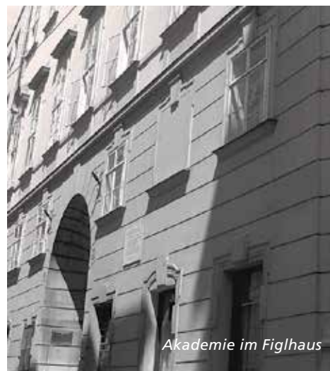
Akademie im Figlhaus

Der Medien-Lehrgang ist eine gute Investition für mutige MedienmacherInnen und MediennutzerInnen.