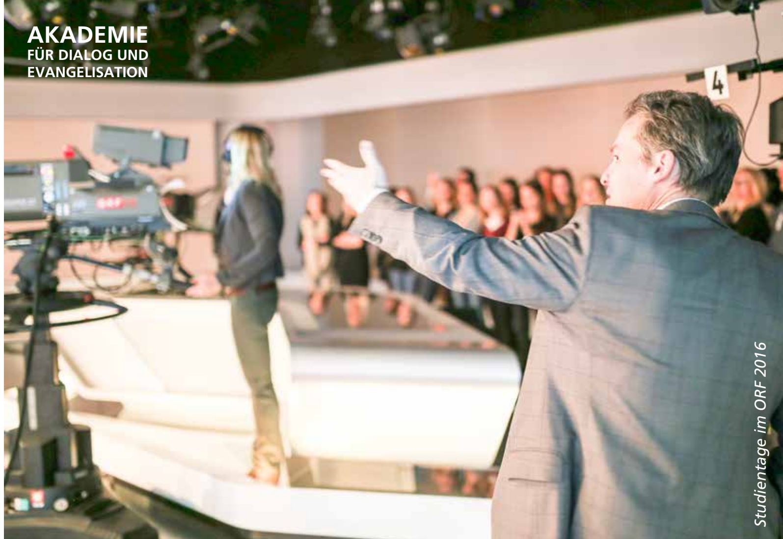
Studientage im ORF 2016